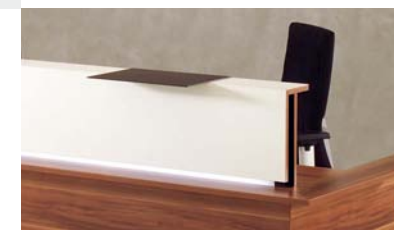
5 | CASUS

CASUS - in jedem Fall ein schöner Empfang definitely a beautiful welcome · in ieder geval een mooi ontvangst