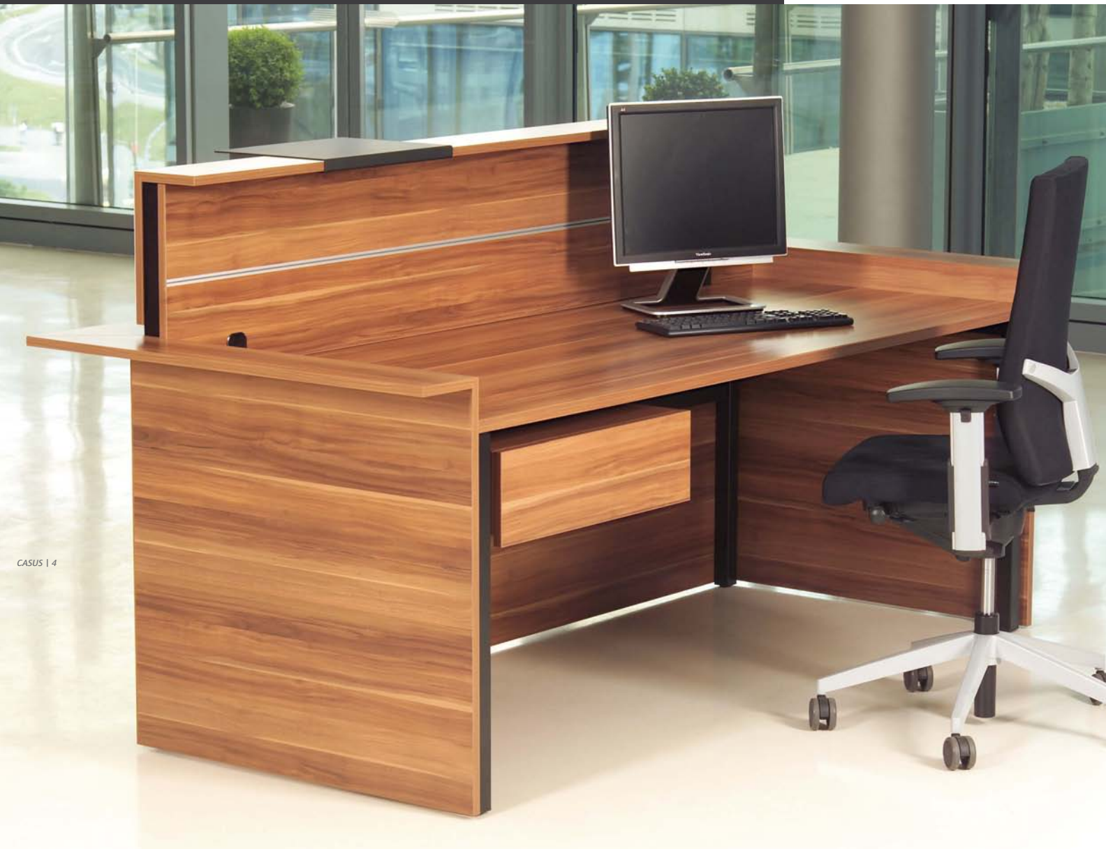
CASUS | 4